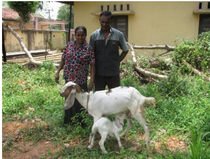
Een nieuw gezin dat deel kan nemen aan het Geitenproject in Sri Lanka

de moedergeit voldoende melk produceert voor het jonge geitje en voor het hele gezin.