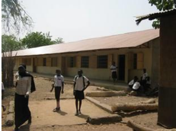
Het nieuwe gebouw, leerlingen en leraren gaan weer met plezier naar school

De kosten voor de renovatie bedroegen € 14.500,00, de kosten voor het meubilair en de inrichting € 5.110,00. Voor de realisering van het hele project, renovatie en inrichting was in totaal € 19.610,00 nodig. De Stichting Katholiek Onderwijs heeft zelf € 1110,00 aan het project bijgedragen.