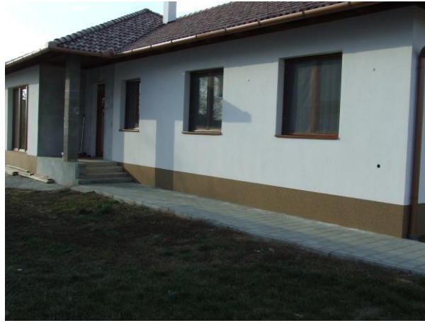
De nieuwe Habitat woning is opgeleverd.