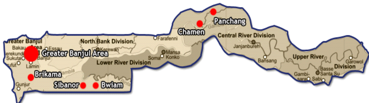
Bwiam ligt in het zuiden van Gambia en is het centrum van de regio

De komende maanden gaat de Stichting ZOM actie voeren om het benodigde geld bij elkaar te krijgen. De Wilde Ganzen gaan het project ondersteunen door het bedrag dat de Stichting ZOM bij elkaar brengt met 55% te verhogen.