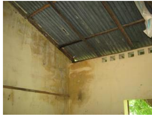
Gaten in de dakplaten, roest en schimmel langs de muren

De komende maanden gaat de Stichting ZOM actie voeren om het benodigde geld bij elkaar te krijgen. De Wilde Ganzen gaan het project ondersteunen door het bedrag dat de Stichting ZOM bij elkaar brengt met 55% te verhogen.