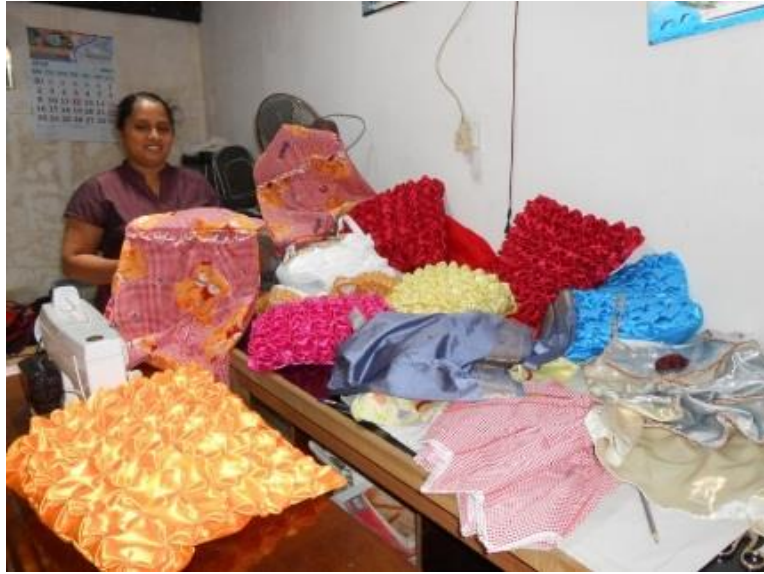
Een van de deelnemers aan het Atelierproject met gemaakte producten