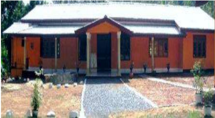
Het gebouw in is het najaar van 2011 officieel geopend.

Het project is mede tot stand gekomen dankzij de financiële bijdrage uit de acties van de leerlingen en personeel van het Liemers College, de bijdragen van organisaties, bedrijven, serviceclubs, de wereldwinkel te Zevenaar en veel particuliere sponsors en mede dankzij de subsidies van de Wilde Ganzen en de NCDO. Zonder de bijdragen van deze laatste organisaties was de uitvoering van het project onmogelijk geweest.