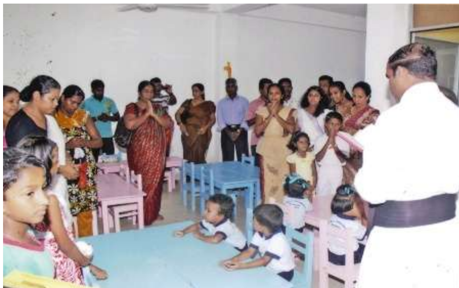
De feestelijke opening van kleuterschool in Sedawatta