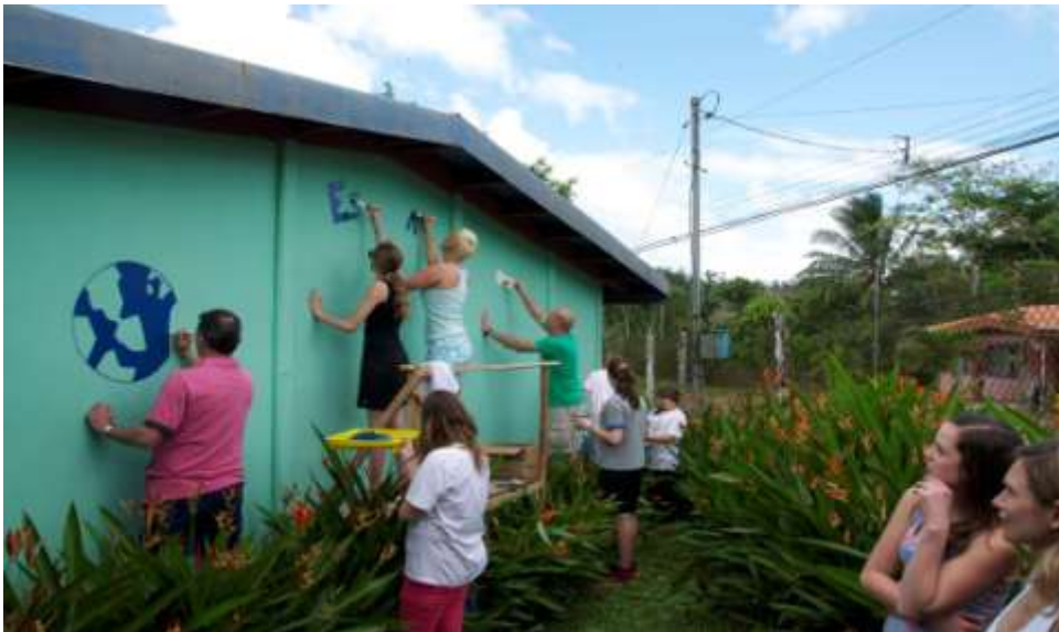
Samen aan de slag in Costa Rica

Om het project nog een extra dimensie te geven, hebben 10 leerlingen en 5 begeleiders een bezoek gebracht aan Costa Rica en de projectscholen bezocht. Naast een geweldige ervaring hebben de leerlingen zelf kunnen zien hoe het geld in Costa Rica is besteed.