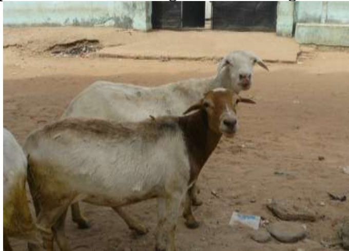
De eerste twee “deelnemers” aan het geitenproject

voor de geiten weer een nieuw gezin voordraagt. Op deze wijze groeit de coöperatie en het aantal geiten per gezin. Wanneer er meer melk wordt geproduceerd dan nodig is wordt de melk verkocht, de coöperatie kan daar een rol in spelen. Zo verdienen de gezinnen ook nog wat extra's.