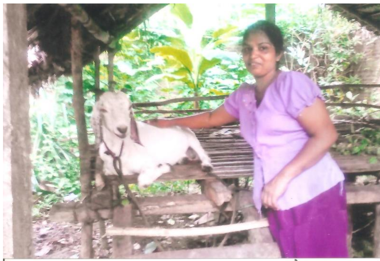
Een nieuw gezin is erg blij met hun geiten, de geiten hebben een veilig onderkomen voor de nacht.

Samen met pater Franciscus zullen we de komende tijd bespreken hoe we verder gaan met het "Geitenproject".