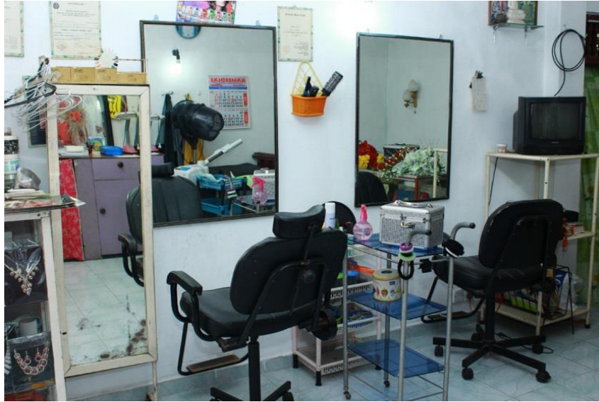
De inrichting is compleet met alle benodigde gereedschappen en materialen.