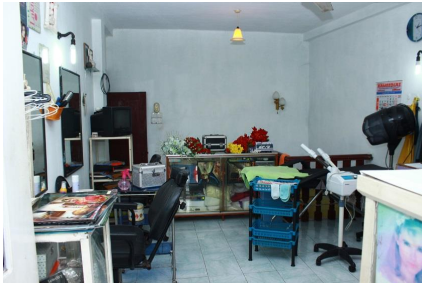
Al ontbreekt het nu nog wel aan voldoende kast- en opbergruimte.