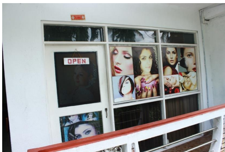
De ingang van de salon.