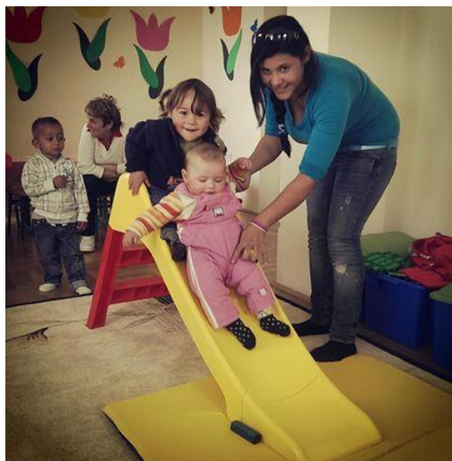
Kinderen, leidsters en ouders werken samen aan betere startkansen

Het Sociaal-medisch Kinderdagverblijf in Opayi functioneert goed. Kinderen gaan samen met hun ouders naar de opvang. De kinderen worden begeleid en de ouders krijgen les in allerlei vakken om hun sociale achterstand in te lopen en de kinderen een beter bestaan te kunnen geven. Medewerkers van de Stichting ZOM hebben meegewerkt aan de voorbereidingen en de opzet hiervan. De mogelijkheid om in Mátészalka een dergelijk kinderdagverblijf te starten wordt onderzocht. Er zijn plannen om het ZOM huis hiervoor te gebruiken.