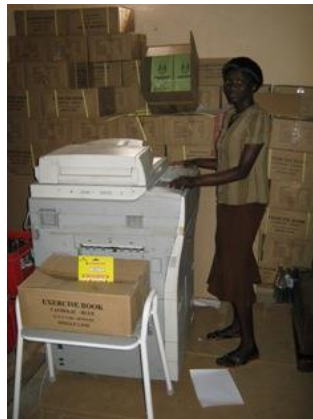
Elke dag worden er duizenden kopien gemaakt

In de printshop kan nu zelf drukwerk worden gemaakt, zoals lesmaterialen, proefwerken en examenvragen, voor de 90 scholen. Daarmee kunnen leerlingen en leerkrachten worden ondersteund in het realiseren van beter onderwijs