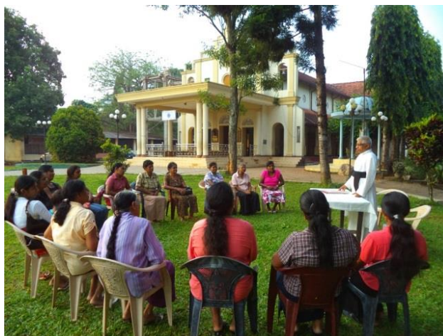
Een bijeenkomst van groep deelnemers die mee willen doen aan het atelierproject

In de regio Nittambuwa zijn er veel werkelozen en met name vrouwen. Het dorp ligt buiten de toeristen regio's en verder is er weinig tot geen industrie. De vrouwen stellen het zeer op prijs als er een atelierproject in Nittambuwa wordt gestart. In de normale gezinsomstandigheden zorgen de vrouwen veelal voor de kleding door zelf veel te maken. Vrouwen die deelnemen aan het project zijn erg gemotiveerd en dat geeft veel energie om het project op te starten en op goede resultaten.