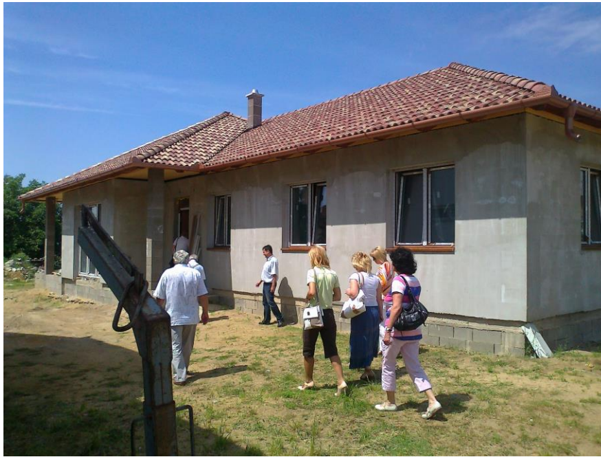
De Zevenaarse delegatie op bezoek bij de nieuwe HABITAT woning

De huizen worden gefinancierd met de opbrengsten van de bestaande 4 huizen.