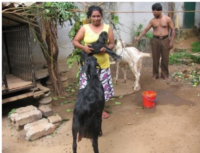
Een nieuw gezin dat deel kan nemen aan het Geitenproject in Sri Lanka

De eerste jongen geitjes zijn geboren en intussen zijn er 6 bij gekomen. De deelnemers zijn erg trots op de nakomelingen en verder betekent dit dat de moedergeit voldoende melk produceert voor het jongen geitje en voor het hele gezin.