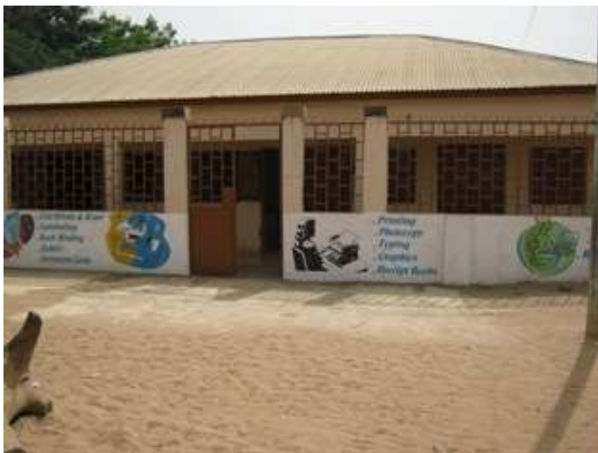
In dit gebouw wordt de printshop gehuisvest

Op verzoek van de Stichting voor Katholiek onderwijs in Gambia is de ZOM een actie gestart om geld in te zamelen voor de inrichting van een printshop. Hier worden lesmaterialen en examens afgerukt. In Gambia is een groot tekort aan boeken en lesmateriaal. Veel scholen leren nog met de “voor- en nazeg” methode. De actie wordt ondersteund door de Wilde Ganzen. Voor dit doel is een eigen bijdrage van € 8.000 nodig. Met daarnaast een premie van 55% van de Wilde Ganzen en een eigen bijdrage uit Gambia. De voorbereidingen van het project en de inzamelingsactie van de ZOM zijn gestart en het project moet in 2013 worden gerealiseerd.