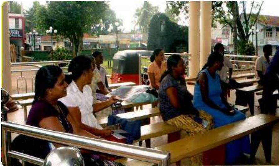
Een bijeenkomst van groep deelnemers die mee willen doen aan het atelierproject

De redenen om deel te nemen zijn werkgelegenheid en de kans om het (te) lage gezins inkomen te verbeteren en zo betere leefomstandigheden creëren voor hun gezin en vooral de kinderen. Maar ook om mee te helpen om creatieve eigenschappen verder te ontwikkelen, voldoening te verkrijgen en een positieve bijdrage te leveren aan de samenleving.