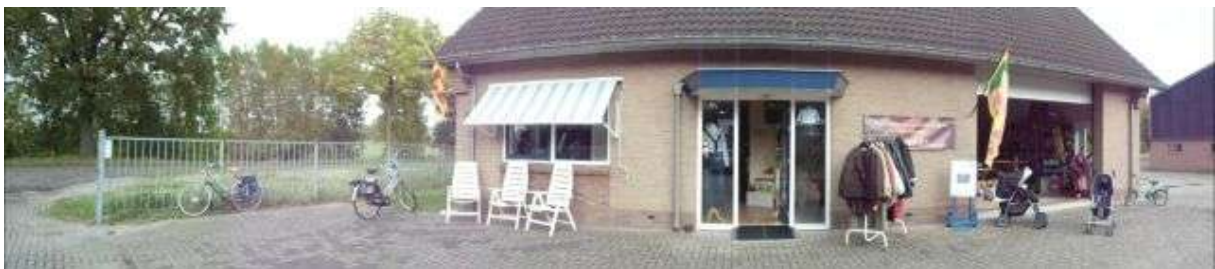
De winkel van NADRI aan de Reisenakker te Zevenaar

Nandri is gehuisvest aan de Reisenakker 3 in Zevenaar.