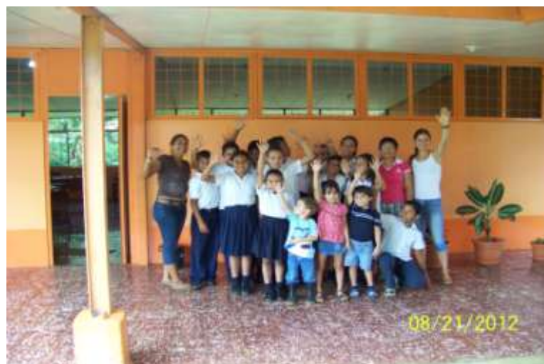
Blijde kinderen in een gerenoveerde school in Costa Rica