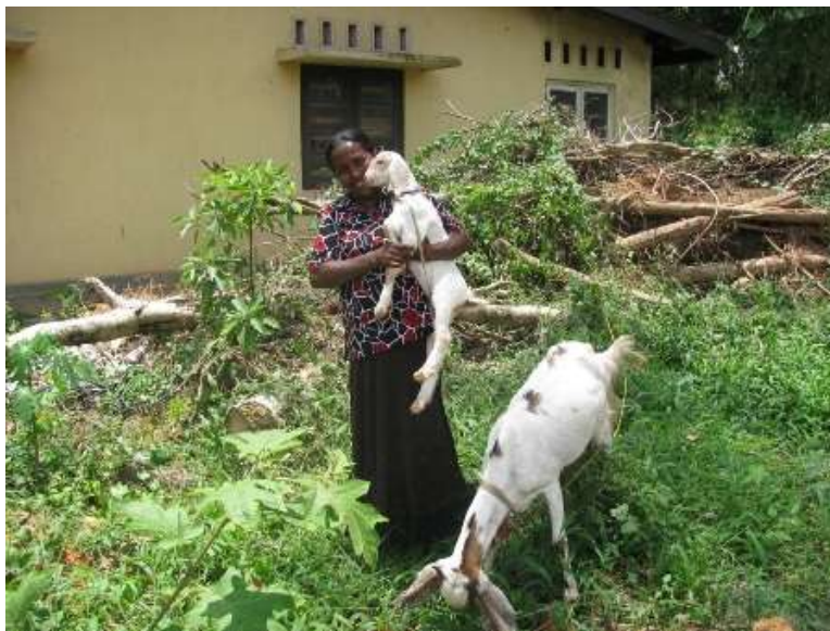
De eerste “nakomeling” van het geitenproject

De gezinnen die deelnemen betalen een (kleine) borgsom om lid te worden van de coöperatie, zij krijgen van de coöperatie 3 geiten. De coöperatie zorgt tevens voor onvoorziene kosten, zoals de kosten voor verzekering en de dierenarts. De opbrengst is voor het gezin, als “aflossing” staan ze elk jaar de eerste geit die wordt geboren en groot genoeg is, af aan de coöperatie, die voor de geiten weer een nieuw gezin voordraagt. Op deze wijze groeit de coöperatie en het aantal geiten per gezin. Wanneer er meer melk wordt geproduceerd dan nodig is wordt de melk verkocht, de coöperatie kan daar een rol in spelen. Zo verdienen de gezinnen ook nog wat extra's. In 2012 zijn de eerste jonge geitjes geboren en in 2013 kunnen nieuwe gezinnen aan het project deelnemen.